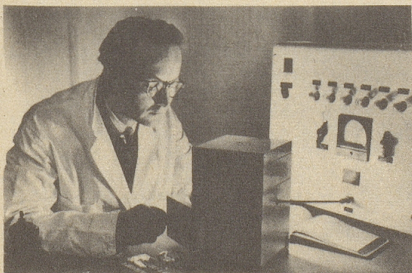
Wissenschaftlich bewiesen: Die Aufbau- stoffe von Neo-Silvikrin gelangen bis in die Haarwurzeln!

Bestimmt haben auch Sie schon dies oder jenes unternommen, um den Haarausfall aufzuhalten . . . und das Ergebnis??? Jetzt endlich brauchen Sie nicht mehr den Mut zu verlieren, denn es gibt ja Neo-Silvikrin — die auf der ganzen Welt anerkannte biologische Haarnahrung! Die erste Voraussetzung für die Wirksamkeit eines Haarpräparates ist: Seine Wirkstoffe müssen bis in die Haarwurzeln gelangen!