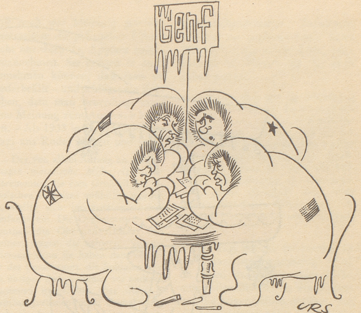
Abrüstung aufs Eis gelegt?