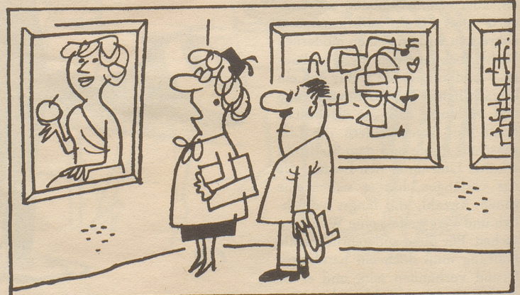
«Bei dem komme ich nicht nach.»