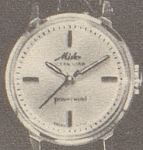
6001 Stahl Fr. 278.- Goldplaque Fr. 295.- 18 K Gold Fr. 495.-