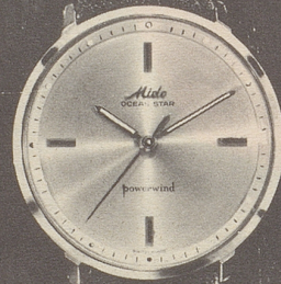
4001 Stahl Fr. 265.— Goldplaque Fr. 325.—