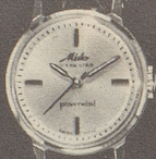
6001 Stahl Fr. 278.— Goldplaque Fr. 295.— 18 K Gold Fr. 495.—