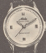
6021 Stahl Fr. 285.— Goldplaque Fr. 295.—