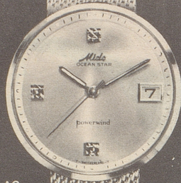
44007 AG Stahl mit Stahlband Fr. 335.—