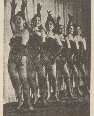
Cabaret Cacadou Lucerne

Das Brockenhaus hat immer Platz für deinen alten Grümpelschatz!