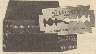
Diese Klinge ist aussergewöhnlich

Bei Kopfweh: Mélabon das bewährte Arzneimittel in Kapseln