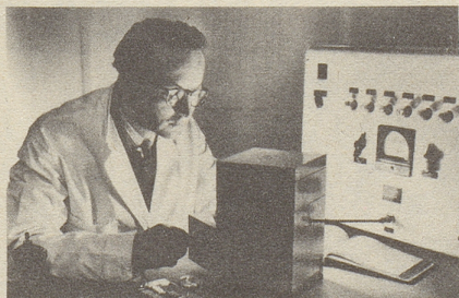
Wissenschaftlich bewiesen: Die Aufbaustoffe von Neo-Silvikrin gelangen bis in die Haarwurzeln!

Bestimmt haben auch Sie schon dies oder jenes unternommen, um den Haarausfall aufzuhalten... und das Ergebnis??? Jetzt endlich brauchen Sie nicht mehr den Mut zu verlieren, denn es gibt ja Neo-Silvikrin — die auf der ganzen Welt anerkannte biologische Haarnahrung! Die erste Voraussetzung für die Wirksamkeit eines Haarpräparates ist: Seine Wirkstoffe müssen bis in die Haarwurzeln gelangen!