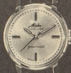
6001 Stahl Fr. 278.— Goldplaque Fr. 295.— 18 K Gold Fr. 495.—