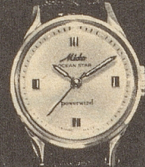
6021 Stahl Fr. 285.— Goldplaque Fr. 295.—