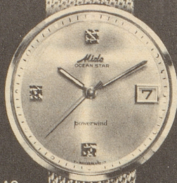
44007 AG Stahl mit Stahlband Fr. 335.—