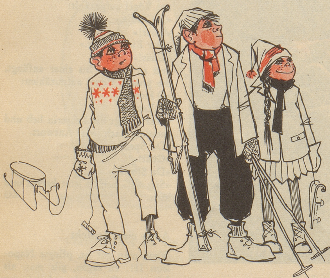
Die letzten drei Vollblut-Amateure