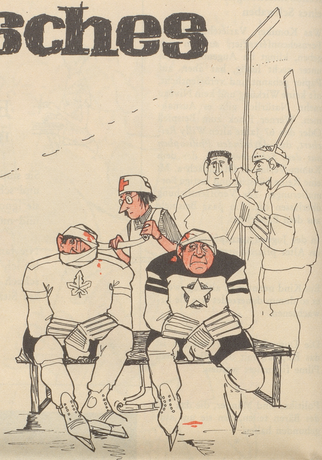
Olympisches Eishockeyturnier gilt zu Recht als völkerverbindende Sportart.