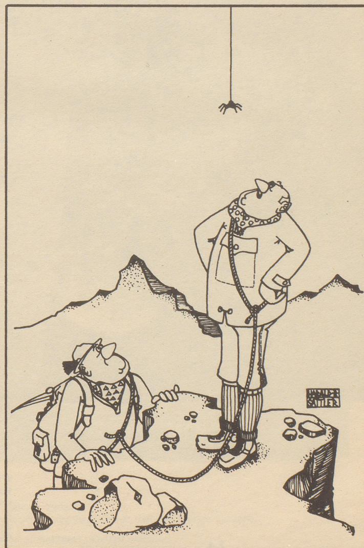
«Mir scheint, wir seien noch nicht ganz zuoberst!»