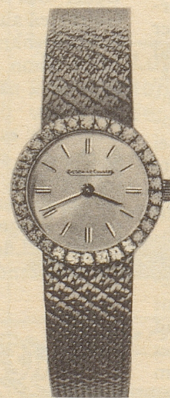
14027 30 Brillanten 18 Kt. Weissgold Fr. 3875.-

* Anlässlich der Landesausstellung 1964 veranstaltete die Schweiz. Uhrenindustrie einen Wettbewerb. Das oben abgebildete Savonnet-Modell aus Platin mit 56 Brillanten und 53 Saphiren erhielt den Ehrenpreis in der Kategorie Brillantuhren. Es ist die kleinste Uhr der Welt. Ihr Werk wiegt mit Zifferblatt und Zeigern nur 1,02 Gramm, doch ist es vierhundertmal sein Gewicht in reinem Gold wert. Einige wenige Exemplare sind von Jaeger-LeCoultre für den Verkauf freigegeben worden. Preis ca. Fr. 20 400.-