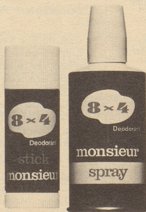
Stick monsieur Fr. 3.60