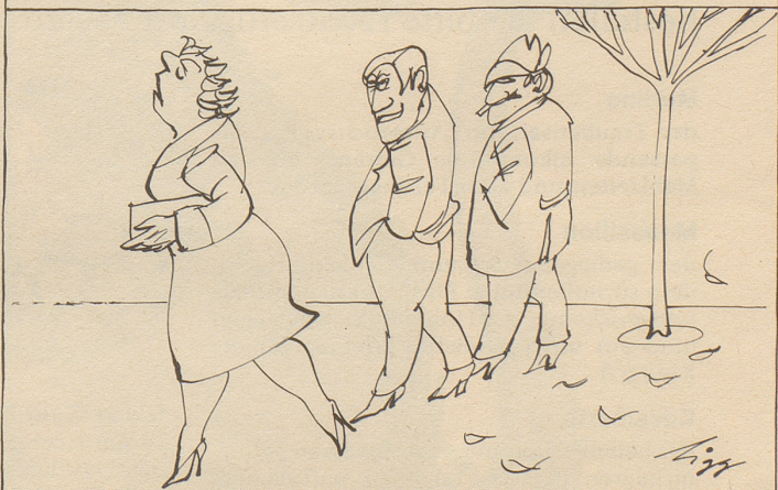
In Schwamendingen, November 1964