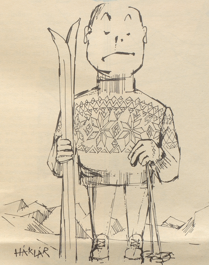
Eine neue Vogelart: Der Innsbrucker Star