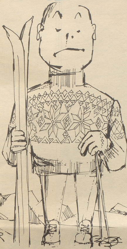
Eine neue Vogelart: Der Innsbrucker Star