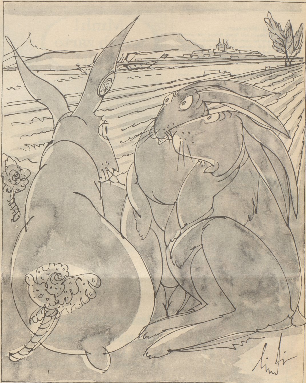
Im Kanton Genf wurden zur Ergänzung des Wildbestandes 250 aus Ungarn eingeführte, durch Metallmarken im Ohr gekennzeichnete Hasen ausgesetzt.

Zwei Millionen Schweizer werden die Expo als Automobilisten besuchen. Weitere zwei Millionen werden in Lausanne herumzumbummeln und sich bei der Gelegenheit zum Fußgängertum bekennen. In der Zeitung lesen wir ferner, die SBB wolle täglich in Lausanne mindestens 15 000 Personen ausladen. Wenn wir auch zugeben, daß es darunter Ausländer hat, so kommen wir trotzdem auf weitere zwei Millionen Schweizer Zugreisende. Weiter bedenke man: Es gibt Hunderttausende von Sängern, Schützen und Turnern, fast ebensoviele Sängerinnen, Jodler, Kegler, Unteroffiziere, Radfahrer, Radiohörer, Naturfreunde, Schwinger, Fußballer, Alpenklübler, Fernseher, Frauenstimmrechtlerinnen, Skiklübler, Markensammler, Sparer, Rentner, Straßenbahnpassagiere, und so weiter. Jedermann leuchtet es ein: Wenn man sie summiert, so hat man leicht die sechs Millionen beieinander, die zur Rechtfertigung der New York Times noch fehlen.