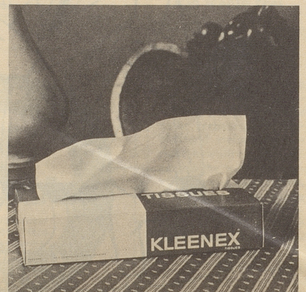
Aber Kleenex – hopp – sprang ein und half, weich, weiss und blütenrein.