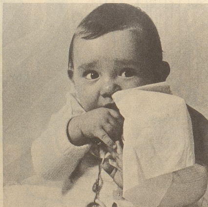
und weich genug für das zarteste Näslein.