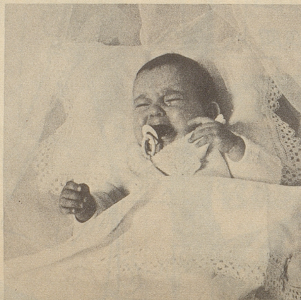
Dann traf das 15. ein!