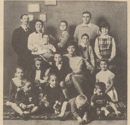
...und hatten deshalb bereits 14!