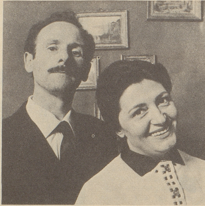
Sie liebten Kinder über alles...