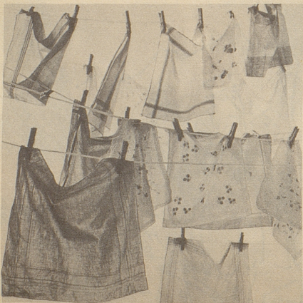
Doch wenn alle erkältet waren: welche Berge von Wäsche!