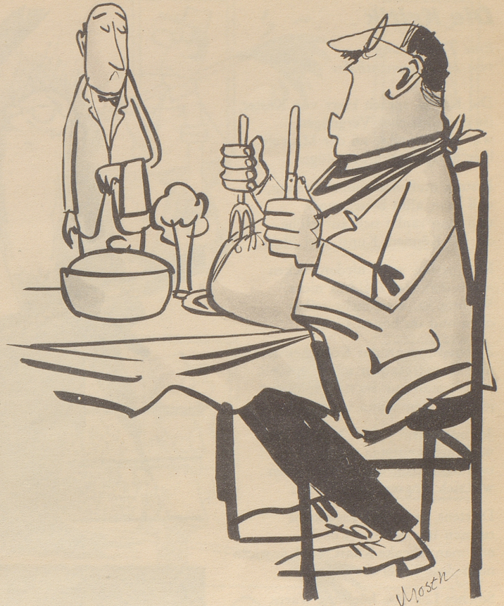
«Sie Garçon — a dem Bifftegg häts ja nüüt als Fett!»

Das ist das Erfreuliche an unserer Zeit: Zu sein, genügt nicht mehr. Dr. med. Politicus