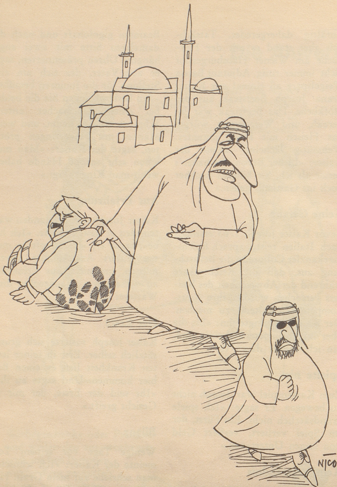
Vier Mitgliedstaaten der VAR distanzieren sich von Nassers deutschlandfeindlicher Politik.