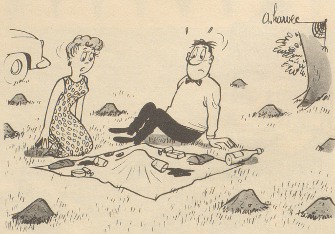
« Scheint hier Maulwürfe zu haben. »