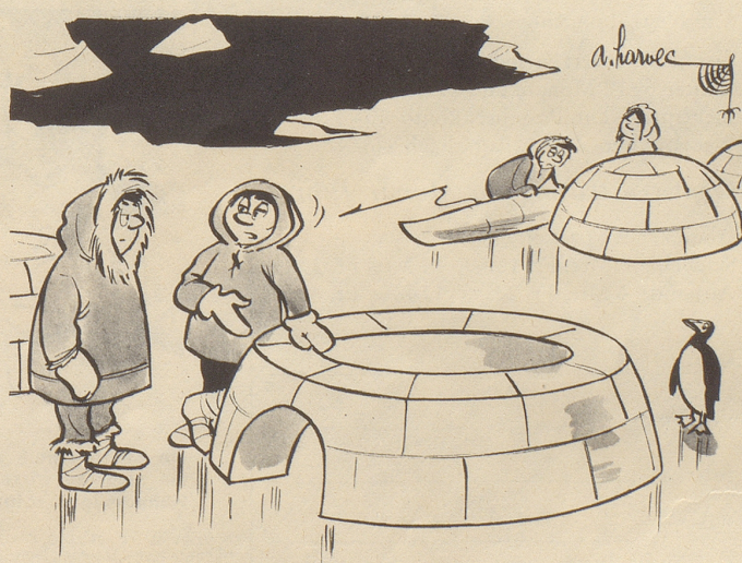
«Unzuverlässig sind diese Handwerker — Seit drei Wochen warte ich auf den Dachdecker!»

Dies gelesen (in einer Filmkritik, notabene): «Würde man den Streifen chemisch reinigen, bliebe nichts als gähnende Langeweile.» Und das gedacht: Und was bliebe vom Filmkritiker, nach chemischer Reinigung?