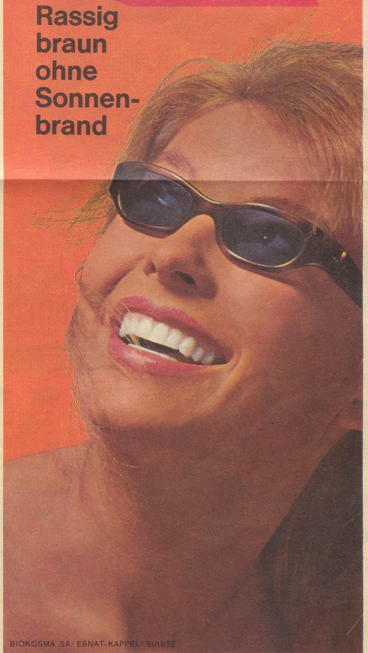
BIOKOSMA SA. EB NAT-KAPPEL / SUISSE