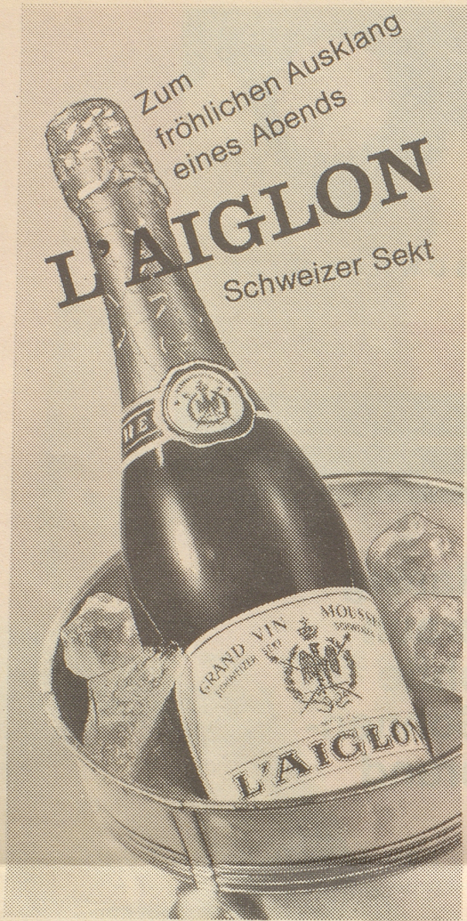
L'Aiglon est élaboré en cuve close par Bourgeois Frères & Cie SA, Ballaigues Ab Fr. 5.60

Zum fröhlichen Ausklang eines Abends L'AIGLON Schweizer Sekt