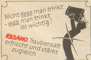
Zu beziehen durch Mineralwasserdepots

noch ein weiteres Jahr nach alter Väter Sitte der Meinung huldigen, unserer Nation stehe es gar nicht so schlecht an, den Tag des Vaterlandes arbeitend und werkend zu verbringen? Statt «in des Vaterlandes Saus und Brause» sich ein nichtstuerisch schlaraffisches oder ein alkoholisch benebeltes Bild vom Land der Sorglosen und Versorgten zu machen. Genügt es nicht, erst am Feierabend den 1. August als