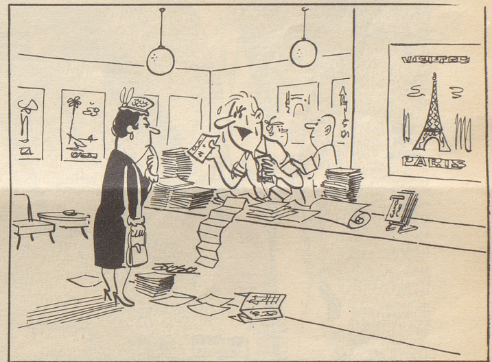
« Tut mir leid — aber das sind wirklich alle Länder, die bis heute entdeckt worden sind ! »