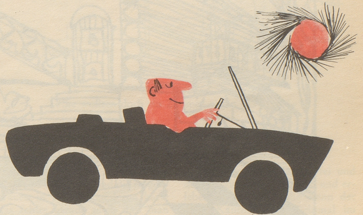
Mensch und Auto Anpassung