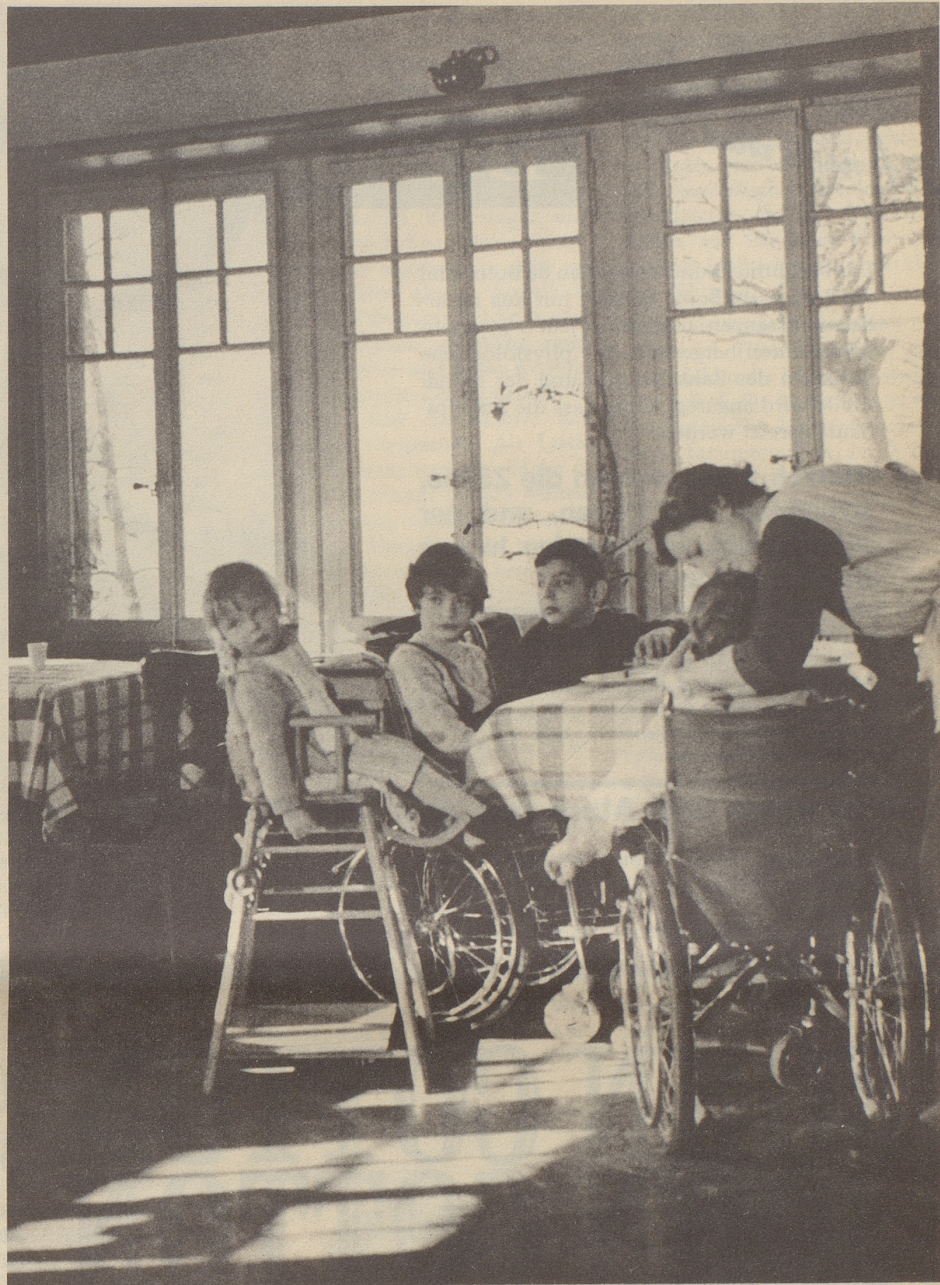
In einem Heim für cerebral gelähmte Kinder

Der Bogen solcher Hilfeleistungen ist weiter gespannt, als man allgemein annimmt. Er reicht vom Studienbeitrag bis zum Bau eines mehrere