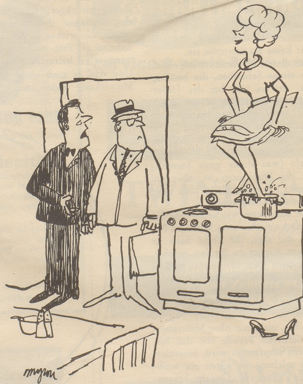
«Bringen Sie ihr doch bitte bei, daß es noch eine andere Art gibt, Kartoffelstock zuzubereiten»

Bethlis Glosse in Nr. 33 über die schönen Bilder (bei uns werden sie von Beamten bei Inventaren gerne diskret als «Tableaux» aufgeführt!) hat mir das Jahrzehnte zurückliegende Erlebnis eines wirklichen Kunstmalers im Zürichbiet in Er-