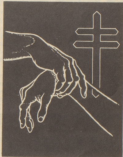
Schweizerische Tuberkulose-Spende nicht vergessen!