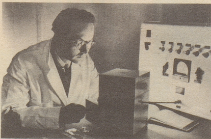
Wissenschaftlich bewiesen: Die Aufbau- stoffe von Neo-Silvikrin gelangen bis in die Haarwurzeln!

Bestimmt haben auch Sie schon dies oder jenes unternommen, um den Haarausfall aufzuhalten... und das Ergebnis??? Jetzt endlich brauchen Sie nicht mehr den Mut zu verlieren, denn es gibt ja Neo-Silvikrin — die auf der ganzen Welt anerkannte biologische Haarnahrung! Die erste Voraussetzung für die Wirksamkeit eines Haarpräparates ist: Seine Wirkstoffe müssen bis in die Haarwurzeln gelangen!