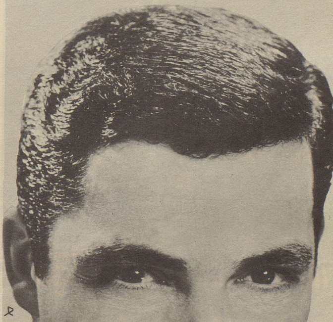
Parfümerie Franco-Suisse, Ewald & Cie. AG, Pratteln/Basel