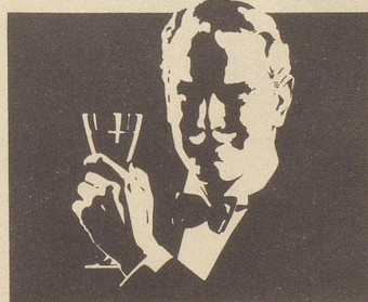
Wie ein Konig gegessen ....

Im Kanton Aargau sollen die angehenden Lehrer und Lehrerinnen, die bisher in Wettingen und Aarau nach Geschlechtern getrennt ausgebildet wurden, inskunftig wieder in gemischten Klassen lernen, wie man in gemischten Klassen lehrt. Bravo! Da haben offenbar sogar Padagogen den erzieherischen Wert von Gemischtklassen und die Tatsache erkannt, da es in der Welt schon seit einiger Zeit zweierlei Leute gibt!