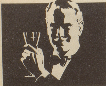
Zu einem Hausball ...

braucht es nicht gleich ein ganzes Haus, auch in der Wohnung gibt es Platz genug zum Tanzen. Verständigen Sie sich aber vorher mit den übrigen Bewohnern – und vergessen Sie nicht, HENKELL TROCKEN kühlzustellen.