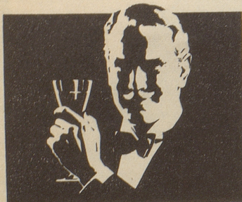
Zu einem Hausball ...

braucht es nicht gleich ein ganzes Haus, auch in der Wohnung gibt es Platz genug zum Tanzen. Verständigen Sie sich aber vorher mit den übrigen Bewohnern – und vergessen Sie nicht, HENKELL TROCKEN kühlzustellen.