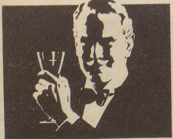
Zu einem Hausball ...

braucht es nicht gleich ein ganzes Haus, auch in der Wohnung gibt es Platz genug zum Tanzen. Verständigen Sie sich aber vorher mit den übrigen Bewohnern – und vergessen Sie nicht, HENKELL TROCKEN kühlzustellen.