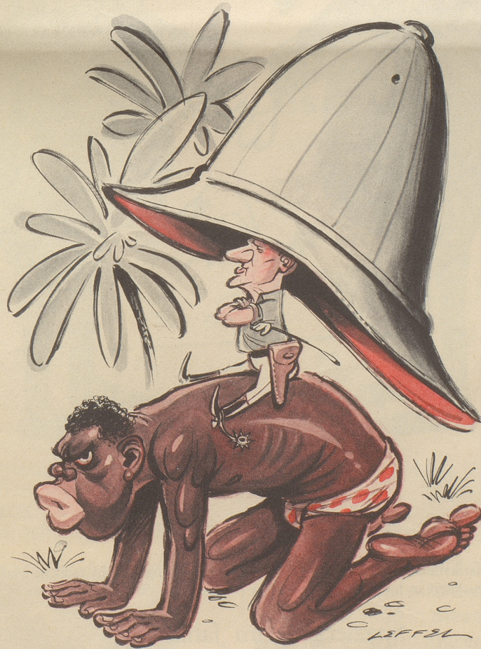
Seine Majestät I(w)an der Schreckliche von Rhodesien

Eine gegen den portugiesischen Diktator Salazar gerichtete Fernseh-sendung von Dr. Hugo Loetscher durfte nicht ausgestrahlt werden. Man habe zwar einen kritischen Bericht erwartet, sagten die Fernsehgewaltigen, aber eine Kritik, wie sie von Dr. Loetscher formuliert werde, dürfe man nicht senden. Nachdem bei uns der Baubeschluß aufgehoben ist, muß auch die Kritik wieder mehr denn je «aufbauend» sein.