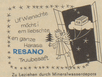
Zu beziehen durch Mineralwasserdepots

«Am letzten Maitag noch wäre Geibels (Die Bäume schlagen aus)