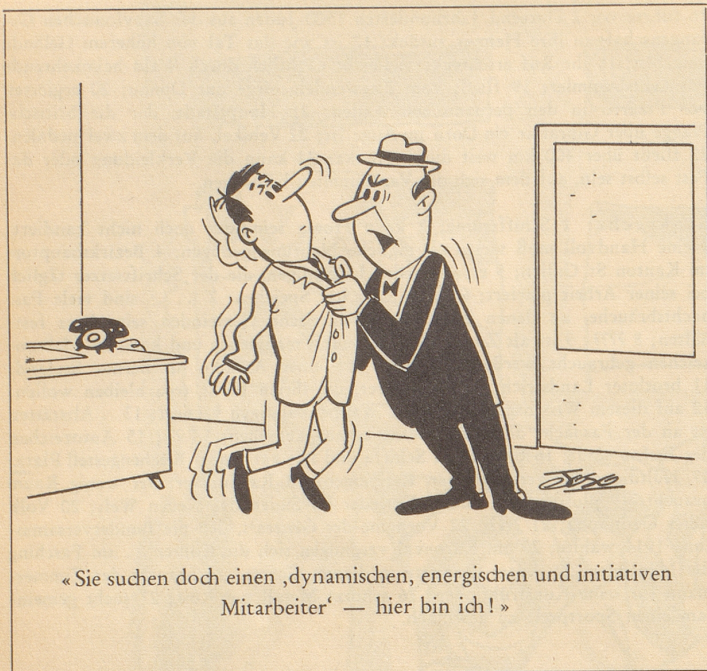
«Sie suchen doch einen ‚dynamischen, energischen und initiativen Mitarbeiter‘ — hier bin ich!»