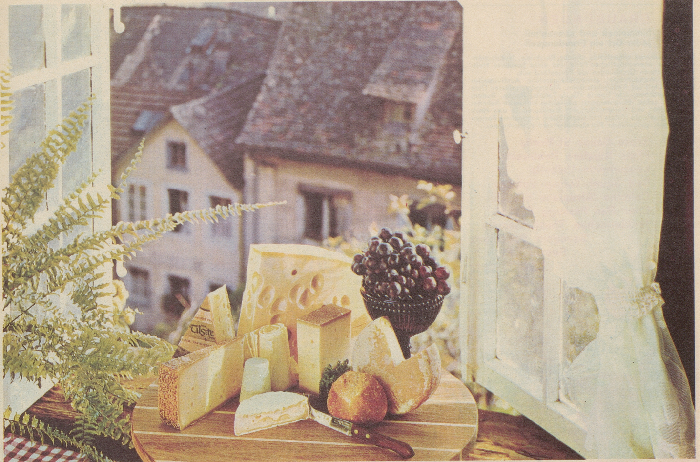
Appenzeller, Marken-Tilsiter, Emmentaler, Hobelkäse, Schabzieger, Camembert suisse, Greyerzer, Reblochon