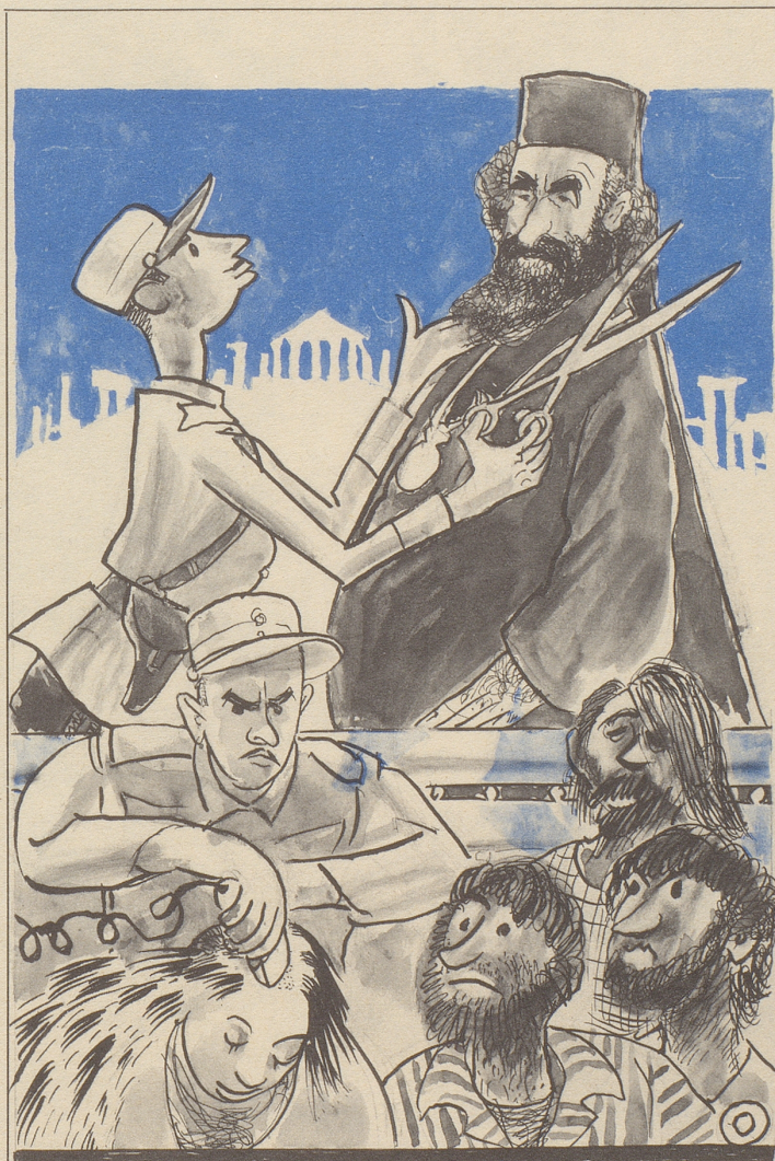
Zeichnung: A. M. Cay

Das Tanzgesetz, das unter anderm Tanzveranstaltungen an Samstagabenden verbietet, soll eine Lockerung erfahren. Sowohl von jungkonservativer wie von jungliberaler Seite sind diesbezügliche Schritte unternommen worden. – Noch steht nicht fest, ob Motion und Gesetzesinitiative der beiden Parteien als Tanz- oder als politische Schritte zu werten sind.