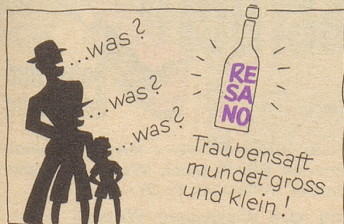
Zu beziehen durch Mineralwasserdepots

Außer Sie photographieren Basels größte Stadtschönheit in einem Aufzuge, mit dem verglichen ein Minikleid etwas sehr Hochgeschlossenes ist. Anmeldungen von Stadtschönheiten, die sich interessieren, sind an meine Adresse zu richten. Ich kann also allen Lesern des Nebelpalters nur ermunternd zurufen: Basel lohnt jeden Besuch – vorausgesetzt, daß Sie photographieren! Das ist aber heutzutage kein Hexenwerk mehr. Ein Gang zum Photohändler und anschließend die Lektüre der Gebrauchsanweisung – und schon sind Sie ein Meister der Kamera! Falls Sie dennoch beim Postkartenwettbewerb in Basel nichts gewinnen, so können Sie immer noch beim Eidgenössischen Departement des Innern für ein Stipendium eingeben. Besagtes Departement hat schon Photographen ausgezeichnet, die nicht einmal so weit gingen, eine Kamera zu benutzen. Welche Chancen müßten Sie dann erst haben!