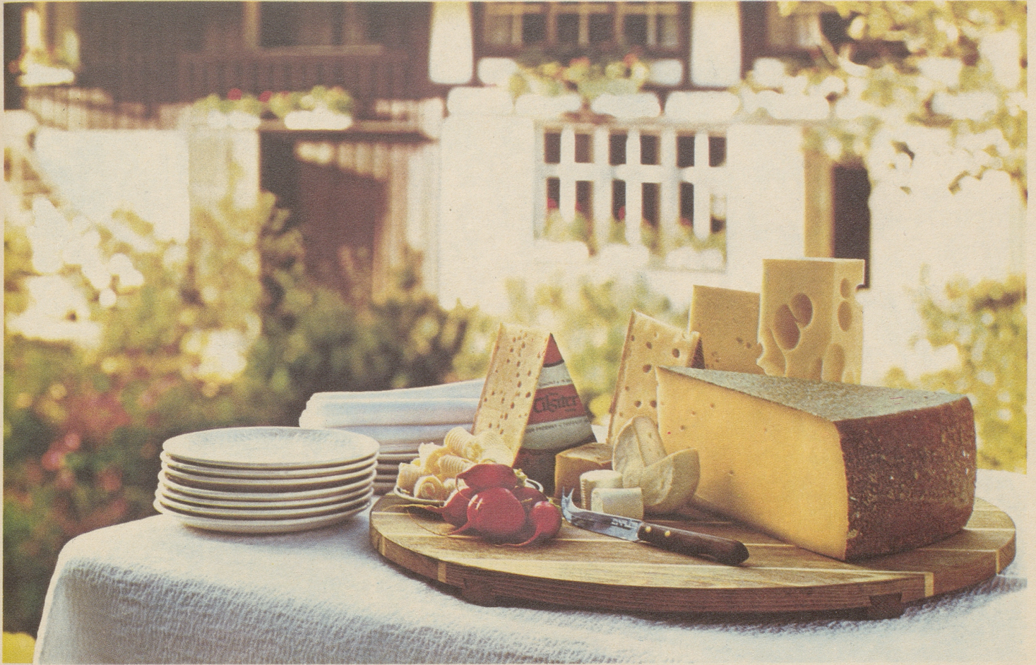
Marken-Tilsiter, Romadour, Petit suisse, Tomme vaudoise, Appenzeller, Greyerzer, Sbrinz, Emmentaler