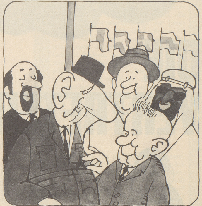
De Gaulle unterstützt die Resolution der «Blockfreien» gegen Israel in der UNO und wird von Kossygin mit dem Leninorden ausgezeichnet.