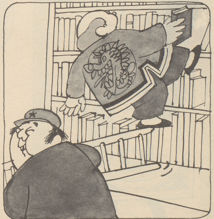
Der chinesische Staatschef Liu Shao-tschü soll gestürzt sein, als er versuchte, das «Rote Buch» Maos in den Bücherschrank zurückzustellen.