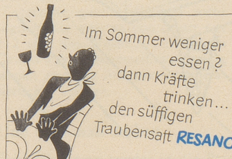
Hersteller: Brauerei Uster

Wenn Sie wissen wollen, wie die ideale Baslerin ist: sie ist blond, hat sehr viel fraulichen Charme und wohnt im Kanton Baselland. Außerdem kommt sie aus Zürich.