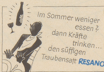
Hersteller: Brauerei Uster

Wenn Sie wissen wollen, wie die ideale Baslerin ist: sie ist blond, hat sehr viel fraulichen Charme und wohnt im Kanton Baselland. Außerdem kommt sie aus Zürich.