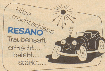
Bezugsquellen durch: Brauerei Uster