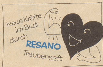
Hersteller: Brauerei Uster