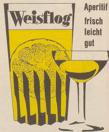
G. Weisflog & Cie. 8048 Zürich-Altstetten