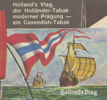
Holland's Vlag, der Holländer-Tabak moderner Prägung — ein Cavendish-Tabak