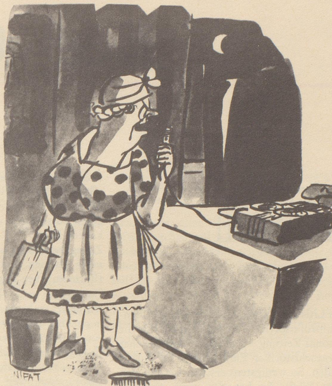
«Gebrauchen Sie in Zukunft gefälligst den Aschenbecher!»

Womit klargestellt wäre: Der Mini ist im Anmarsch, und zwar als modische Etikettierung des belanglosen Wichts. Wer ihn zeit- und selbstbewußt in sein Vokabular aufnimmt, wird in seiner Anwendung keine Schranken dulden – außer der einen natürlichen, daß Minis immer nur die andern sind.