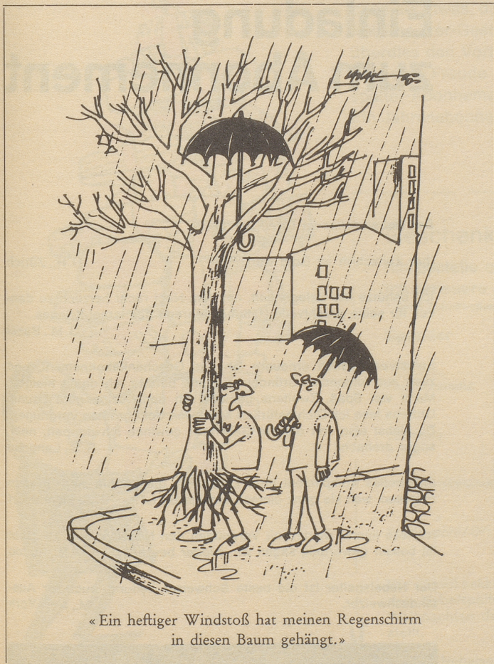
«Ein heftiger Windstoß hat meinen Regenschirm in diesen Baum gehängt.»