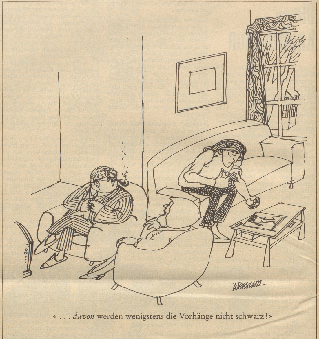
«... davon werden wenigstens die Vorhänge nicht schwarz!»

Nur weil ich Herzspezialist bin – Sie wissen, daß diese zurzeit hoch im Kurs stehen! –, wurde ich vorgestern inne, was den Anlaß zur Sperre und Fahndung gab: Cherchez la femme! – Das wäre an und für sich in der Weltgeschichte nichts Neues und noch weniger etwas Einmaliges. Im Landsgemeindekanton Glarus ging es um die Ehre